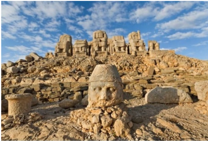
Հայ աստվածների հուշարձանախումբ

հեղինակային ոճով Ղազարյանը սինթեզի մի նոր որակ է հաղորդել հիշյալ աշխատանքին, ներկայացրել հայկական և եվրոպական մտածելակերպերի՝ բնական ու անմիջական շփումով միահյուսման փայլուն օրինակ: Կատարման ինքնատիպության ու ծավալածների պլաստիկ մշակվածության շնորհիվ Տանարիկի (Տեմպլետտոյի) թեման արդիական հնչողություն ու նոր երանգավորում է ստացել: Արա Ղազարյանի ստեղծագործության գնահատման չափանիշը ոչ թե ավանդույթների կամ ազդեցությունների ամկայությունը կամ բացակայությունն է, այլ այն արդյունքը, որ ձեռք է բերել ստեղծագործման ընթացքում: Համահունչ լինելով իր դարաշրջանին՝ նա ընդունված ձևի մեջ ամբողջացրել է իր ժամանակաշրջանի մտայնությունները, զգացողությունները՝ որսալով անանցանելի, էականը, բովանդակայինը: