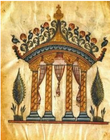
Էջմիածնի Ավետարան, 989 թ., Տանարիկ (Tempietto), Մատենադարան, Ձ. 2374, թ. 5բ

Արա Ղազարյանի ստեղծագործական նկարագրի յուրահատկություններից է սեփական կերպարային լուծումների անդադրում որոնումը, որով կարելի է բացատրել գեղարվեստական ժառանգության՝ նրա գեղագիտական յուրատեսակի մաստավորումը: Ղազարյանի ստեղծած զարդում նշմարվում է Արևելքի ու Եվրոպայի դարաշրջանների գեղարվեստական որոշ ավանդների հեռավոր արձագանքը: Արվեստագետի պայծառ երևակայությունն ու ժողովրդական ազգային արվեստին քաջահմուտ լինելը դիտողին մտովի տեղափոխում են հայկական մանրանկարչության հարուստ աշխարհը: