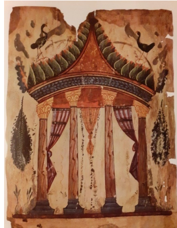
Ավետարան, X դար, Տանարիկ (Tempietto), Մատենադարան, Ձ. 9430, թ. 1 ա

Այս առնչությամբ մասնավորապես կարելի է հիշատակել Մատենադարանի՝ 989 թ. Էջմիածնի Ավետարանում կամ X դարի № 9430 ձեռագրում հանդիպող՝ սյուների վրա հանգչող ու տաղավարաձև ծածկ ունեցող շինությունը՝ Տանարիկը (Տենպիետտո) 8 : Կառուցվածքային ամբողջության ու բաղկացուցիչ մասերի կապի առումով «Տանար» ստեղծագործությունն աղերսվում է նաև իտալական ճարտարապետության Վերածննդի շրջանի՝ Տենպիետտո հիշեցնող ոռ-