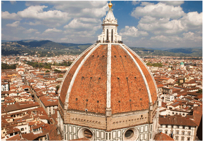
Փ. Բրունելեսկի, Սանտա Մարիա դել Ֆիորեի գմբեթը, 1420-1436