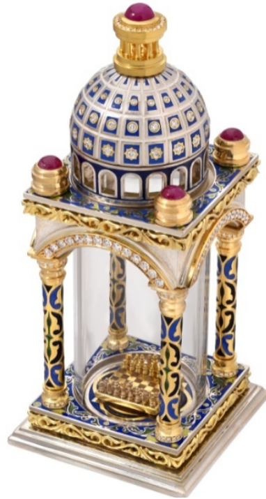
Արա Ղազարյան, «Տաճար», 2019 թ.

«Տաճար» ստեղծագործությունը (բարձրությունը՝ 108 մմ, իսկ լայնությունը՝ 45 մմ) բաղկացած է 108 կտորից՝ պատրաստված 18 և 22 հարգի ոսկով, «Argentium» տեսակի արծաթով: Օգտագործվել է նաև Հայաստանի ծիրանի փայտ: Աշխատանքի գեղարվեստական երեսամշակումն արվեստագետն իրականացրել է արծնապատումով (կիրառված արծնի հիմքը 800°C հալման ջերմաստիճանում ապակե հալույթն է, որն օգտագործվել է հնում) 3 կիրառելով միջպատային 3 , ռելիեֆային և նախազարդային եղանակները: Իսկ ոսկին՝ որպես հիմք, արծնին առանձնակի պայծառություն է հաղորդել: