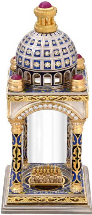
Արա Ղազարյան, «Տաճար», 2019 թ.

Ղազարյանի համար կերպավորման ձևերը, մակերեսները մշակելու միջոց լինելուց զատ, պայմանավորում են առարկայի ամբողջական բնույթը: Հիշյալ աշխատանքի տարրեր հատվածների մակերեսները նա մշակել է ֆակտուրային տարրեր հնարքներով և հաշվարկված միջոցներով հասել առավելագույն արտահայտչականության: