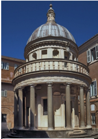
Բրամանտե, Տենպիետոտո 1502-1510 թթ.

տոնդաձև տաճարներին՝ բոլորակ հատակագծով, գմբեթով պսակված կենտրոնակազմ կառույցներին, որոնց պարագծով տեղադրված են սյուներ: