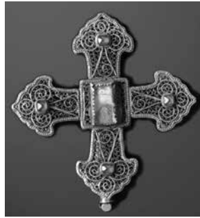
Նկ. 4. խաչ՝ Հովհաննես Մկրտչի մատունքով, Արծկե, 1788 թ.