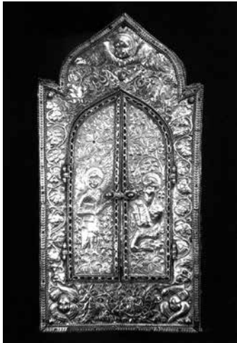
Նկ. 7. Նոյյան տապանի մատունքով պահարան, Քանաքեռ, 1698 թ.

կավե) կամ քարեայ առնաչափ տապաններու մեջ», ապա տապանները թաղում հողի մեջ, «... և Ս. Յովհաննէս Կարապետն ալ ընդունուեցաւ իբր Հայոց աշխարհին երկնաւոր պաշտպանը» 24 :