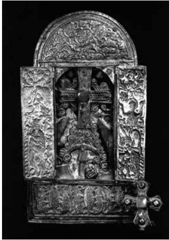
Նկ. 6. Արագածի Ս. Նշան, Սաղմոսավան, 13-րդ