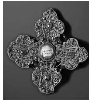
Նկ. 5. խաչ՝ Ս. Գևորգի մատունքով, Վան, 18-րդ դարի 2-րդ կես