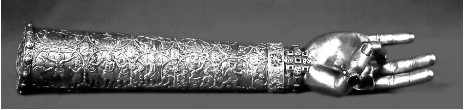
Նկ. 2. Գրիգոր Լուսավորչի Աջը, 1657 թ. գ. Քանաքեռ, 1698 թ.

ժեստով՝ մատնեմատն ու բթամատը միացրած, խորհրդանշելով Սուրբ Երրորդությունն ու հավիտենական տիեզերքը: Աջերը պատրաստվում էին բազլի տեսքով, երբեմն էլ մինչև դաստակը՝ կիրառելով դրվագման, զուգաթելի հնարներ, ընդելուզելով թանկարժեք և կիսաթանկարժեք քարերով: Գրանց վրա պատկերում էին տերունական տեսարաններ (Նկ. 2):