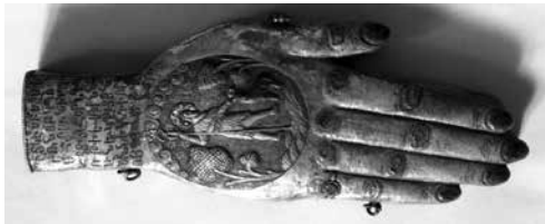
Նկ. 3. Հովհաննու Աջը, 1760 թ.

ներից էր Ադանան (Ադան, Ադանահ, Ադանիա, Անտիոքիս առ Մարոսիվ, Ատան, Ատանա, Ատանա Կիրանոս, Բադնե, Մաքսիմիանոսյան Ադանա, Մարոսյան Անտիոքիս, Սեյհան 20 ), որն առաջին անգամ հիշատակում է Քսենոփոնը «Նահանջ բյուրաց»-ում: Այն Ք. ա. 3-2-րդ դդ. հելլենիստական մշակույթի հայտնի կենտրոն էր, որը Հռոմեական ժամանակաշրջանում (1-4-րդ դդ.) վերածվում է զորակայանի: 10-րդ դարի կեսերին Ադանան հայտնի վաճառաշահ քաղաք էր, որը 12-14-րդ դդ. նոր վերելք է ապրում՝ դառնալով հայ մշակույթի կարևոր օջախներից մեկը, որտեղ զարգանում են առևտուրն ու արհեստագործությունը, մասնավորապես արծաթագործությունը: 14-րդ դարի սկզբին Ադանան հիշատակվում է « հոյակապ ու թագավորական քաղաք » 21 , ուր հիմնվել է նաև արքունի պալատ: 14-րդ դարի կեսերից քաղաքը ասպատակության է ենթարկվում թուրքական մի քանի ցեղերի և Եգիպտոսի մամլուքների կողմից: 1575 թ. Ադանան վերջնականապես գրավում են օսմանյան թուրքերը: