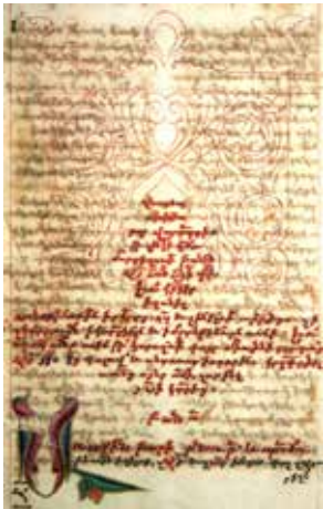
Նկ. 5 ՄՄ Հ տ 1881, էջ 3ա