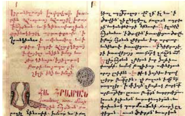
Նկ. 4 ՄՄ Հ տ 3281, էջ 8ա