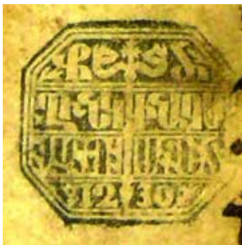
Նկ. 8 ՄՄ Հ տ 704, էջ 105բ