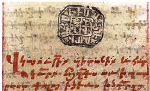
Նկ. 9 ՄՄ Հ տ 3281, 115ա