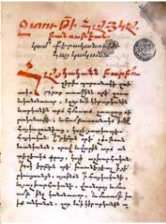
Նկ. 6 ՄՄ Հ տ 2289, էջ 4ա