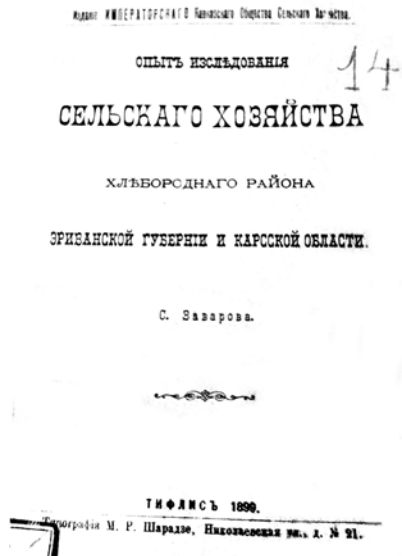
Ս. Զավարյանի «Երևանի նահանգի և Կարսի մարզի հացաբեր շրջանների ուսումնասիրության փորձ» գրքի տիտղոսաթերթը

Այս հուշագրից նաև տեղեկանում ենք, որ Ս. Զավարյանը դեռևս Պետրովյան ակադեմիայում ուսումնառության վերջին շրջանում հետազոտել է Զուլթայիսի նահանգի գյուղատնտեսությունը, որն Ակադեմիայի կողմից