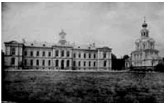
Մոսկվայի Պետրոսյան գյուղատնտեսական ակադեմիայի մասնաշենքը 19-րդ դարի վերջին

Հետաքրքիր զուգադիպությանը, երբ Հայաստանն աշխարհի գեղատեսիլ Լոռու Այգեհատ գյուղում 1865-ին ծնվեց ապագա քաղաքական գործիչ և գիտնական-գյուղատնտես Միմոն Զավարյանը, նույն տարվանից Մոսկվայի արվարձաններում սկսեց գործել նորաբաց Պետրոսյան (Պետրովսկո-Ռագումովսկի) գյուղատնտեսական ակադեմիան: