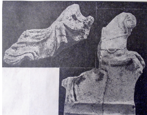
Նկ. 1. Տիգրան Մեծի դարաշրջանի հեծյալների կավե արձանիկներ

Արձանիկները մեզ են ներկայացնում Տիգրան Մեծի առաջնորդությամբ ռազմի և փառքի ուղին անցած հայ մարտիկին՝ Արտաշեսյանների օրոք տղամարդու նորմատիվ պատկերը, այլ կերպ ասած՝ առնականության իդեալը (դրա կատարյալ մարմնացումը թագավորն էր):