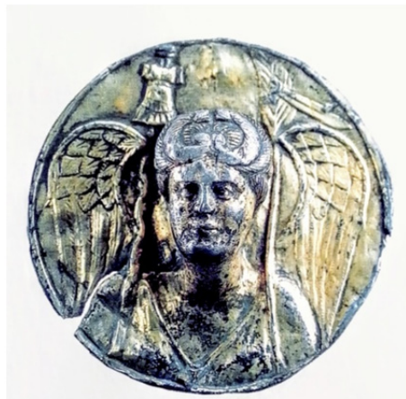
Նկ. 3. Հայկական Նիկե

հարյուրապետից հանված լանջապանակն ու սաղավարտը: Հայկական Նիկեն հելլենիզմի ժամանակաշրջանի արվեստի հազվագյուտ նմուշներից է, որոնք փառաբանում էին հռոմեացու նկատմամբ հաղթանակը: Այդ պատկերի խորհուրդը հստակ է. խաղաղությունն ու անդորրը հնարավոր են միայն թշնամուն հաղթելուց հետո: