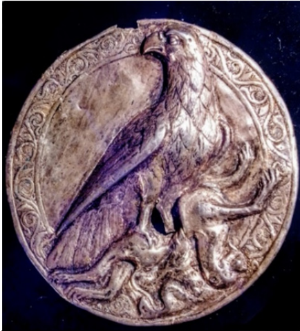
Նկ. 4. Տիգրան Մեծի պետական խորհրդանիշը

արտահայտված դիցաբանական կերպարների միջոցով 28 : Արծիվը հայ առասպելաբանության մեջ աստվածային լույսի մարմնացումն է և Արտաշեսյան արքայի կերպարը: Մեղալիոնի արծիվը՝ Տիգրան Մեծի թագի արծիվը, խրոխտ ու հաղթական հայացքը հառել է դեպի վեր՝ դեպի արեգակը : Նրա ոտխը՝ նրա հզոր ձանկերում շունչը փչող հովազը, մարմնավորում է քառսն ու խավարը: Հովազը սանձարձակության և գինարբուքի աստծուն՝ Դիոնիսոսին պատկանող և նրան խորհրդանշող կենդանին է: Եվրիպիդեսի պիեսում Դիոնիսոսը տիրապետում է մարդու մեջ ներփակ ոչ բանական (իռացիոնալ) ինքնակործան տարերքին, արձակում ագրեսիվ նկրտումները: Տեսարանն ամփոփում է Տիգրան Մեծի դարաշրջանի պետական գաղափարաբանության ակնհայտ խրոխտությունը: Ըստ էության, այն արքայի քաղաքական պատգամն է՝ հազարամյակների խորքից եկած ուղերձը՝ չարի դեմ անհաշտ պայքարը և բարու (լույսի