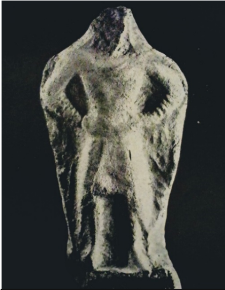
Նկ. 2. Տիգրան Մեծի հայ զինվորը

վետ» 27 : Հայ մարտիկն իր հաղթ բազուկները կանթել է իր ձիգ և մարզված իրանին: Ուսերն ընդգծված լայն են ու հզոր: Նա ամուր է